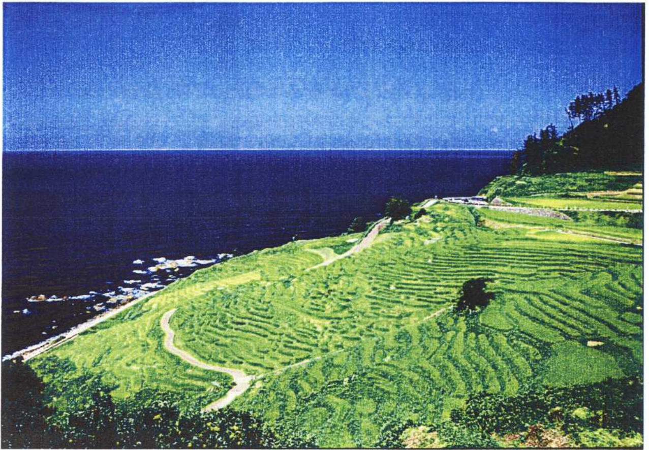
輪島市白米の千枚田

平成23年6月11日、中国北京で開催された国連食糧農業機関（FAO）主催の国際フォーラムにおいて、「能登の里山里海」が「世界農業遺産（GIAHS）」に認定されました。