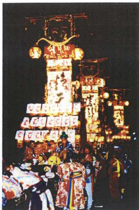
能登のキリコ祭り

そうした中で、田の神に感謝する神事で、ユネスコの無形文化遺産に認定されている「あえのこと」、キリコ祭り、輪島朝市など農村の暮らしと結びついた風習や文化が多く残っていること。